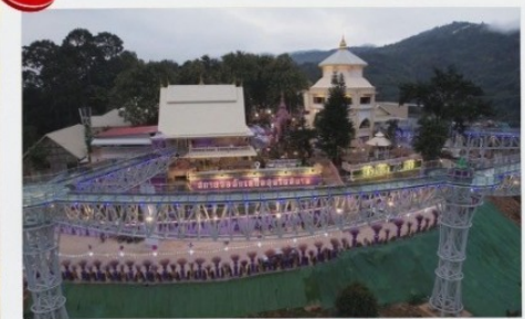
สกายวอล์ค

2 ท่านขึ้นไป 14,499 บาท/ท่าน 4 ท่านขึ้นไป 12,799 บาท/ท่าน 6 ท่านขึ้นไป