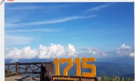
จุดชมวิวที่มีความสูง 1715