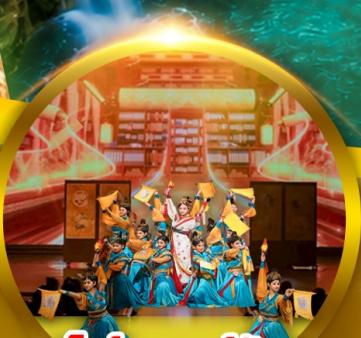
โศวราชวงศ์ถิ่ง