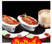
เปิดปิกนิก