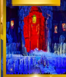
โชว์เส้นทางสายไหม