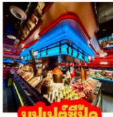
บุฟเฟต์ซีฟู้ด