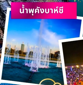
น้ำพุคังบาศี