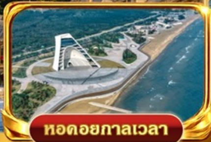
หอดอยกาลเวลา