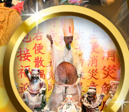
เทพเจ้าเสื่อกระสอบ พิธีลูบพัดโบราณ