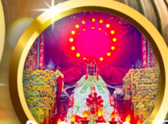
เจ้าแม่กวนอิมฮ่องกง ร่ำรวยเงินทองไหลมาเทมา