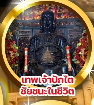
เทพเจ้าปิกไต้ ชัยชนะในชีวิต