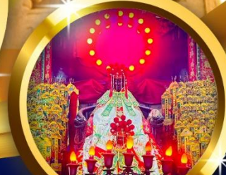
เจ้าแม่กวนอิมฮ่องกง รำรวยเงินทองไหลมาเทมา