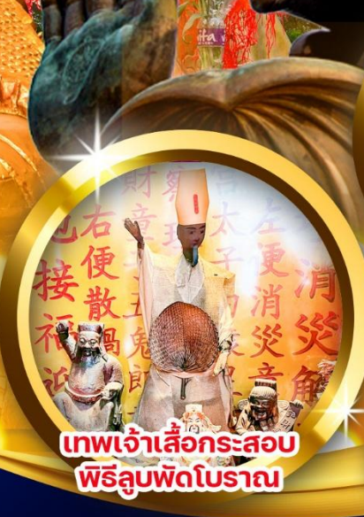
เทพเจ้าเสื่อกระสอบ พิธีลูปัดโบราณ