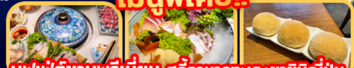
บุฟเฟ่ต์ชาบูพรีเมียม สุกี้อาหารทะเล+ชาฮิมิญี่ปุ่น ต้มชำระดับมิชลินสตาร์