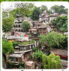
ตรอกโบราณเซี่ยฮ่าวหลี่