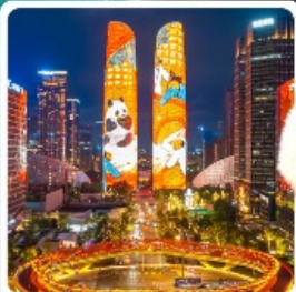
ตึกแฝดเจิงตู