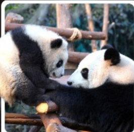
หุบเขาแพนด้าดูเจียงเอี้ยน