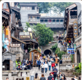
ถนนคนเดินสี่ปาตี้