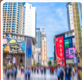
ถนนคนเดินเจี่ยฟางเป็ย