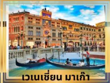
เวเนเชียน มาเก๊า