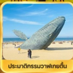
ประมาติกรรมวาฬเกยตื้น