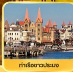
ท่าเรือชาวประมง