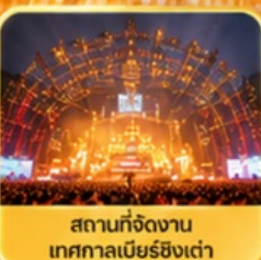
สถานที่จัดงาน เทศกาลเบียร์ชิงเต่า