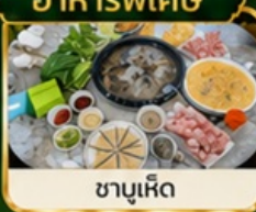
ชาชูเหิด