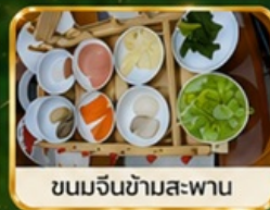
ขนมจีนซำมสะพาน