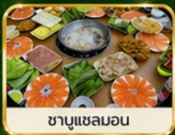
ชาชูแชลมอน