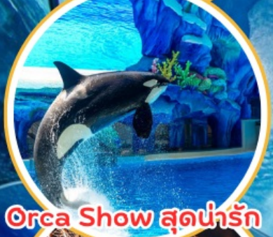
Orca Show สุดน่ารัก