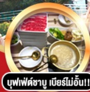
บุฟเฟ่ต์ชาบู เสิร์ฟไม่อั้น!!