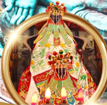
ยืมเงินเจ้าแม่กวนอิมสองฮา