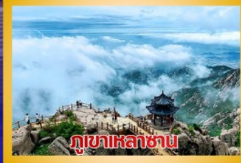
ภูเขาเหลาชาน