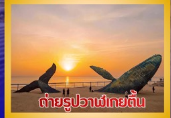
ต่ายรูปวาฬยักษ์ตื่น

สะพานจันเจียว-โบสถ์คาทอลิกชิงเต่า (ชมภายนอก)-ป่าตึกวน- พิพิธภัณฑ์เบียร์ชิงเต่า -ถนนคนเดินโตตง -ผิงไห่เก้อ-ชายหาดและ จุดต่ายรูปปลาวาฬยักษ์ตื่น -ถนนจ้าววีป่าเจีย-ชายหาดลากวอไห่- จัตุรัสซิงฟุเหมิน-สวนเว่ยไห่ -สวนเยวี่ไห่-เกาะหยางหม่าย่าน - เมือง กำเปียนไถ-ท่าเรือชาวประมงเหยียนไถ-ภูเขาเหยียนไถ-จัตุรัส 54 -ศูนย์ โอลิมปิกเรือใบชิงเต่า-ภูเขาเหลาชาน-วัดไท่ซิงกง-สวนเสี่ยวม่วยเต่า ชายหาดทะเลหมายเลข 3-อาคารไห่เทียน ชั้น 81- Cyber Punk