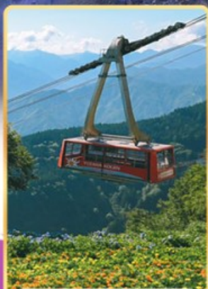
นั่งกระเช้าชูซาว่าโคเอ็น