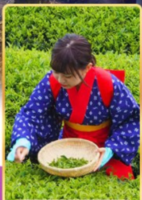
กิจกรรมเก็บชา