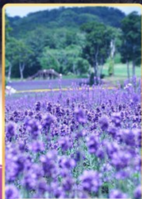
ทุ่งลาเวนเดอร์ทามบาระ