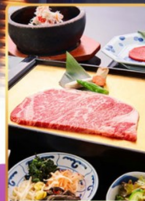
บุฟเฟ่ต์ ROKKASEN