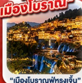
“เมืองโบราณฟู่หลงเจิ้น”