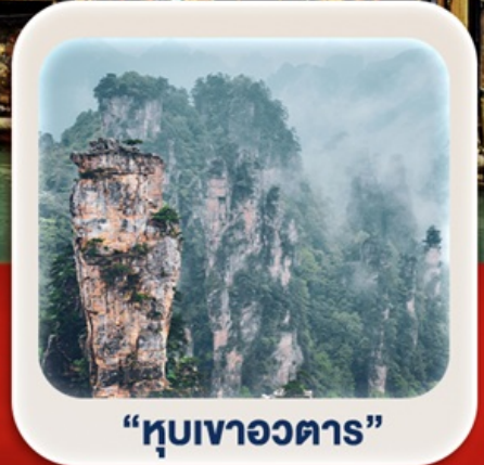
“หุบเขาอวตาร”

นั่งกระเช้าชมภูเขาเทียนเหมินซาน • กำประตูลิ่วหวง • ตึกมหัศจรรย์ 72 ชั้น เมืองโบราณเฟิ่งหวง (ล่องเรือ) + เมืองโบราณฟู่หลงเจิ้น **พักติดเมืองโบราณ 2 คืน** ภูเขาเทียนจื่อซาน • หุบเขาอวตาร • สะพานแก้ว+VR4D • ชมโชว์จิ้งจอกขาว