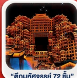
“ตึกมหัศจรรย์ 72 ชั้น”