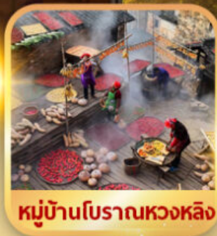
หมู่บ้านโบราณหวงหลิง