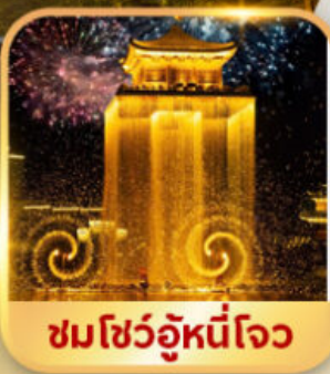
ชมโชว์อุหนี่โจว