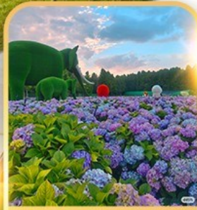
ดอกไม้ตามฤดูทง