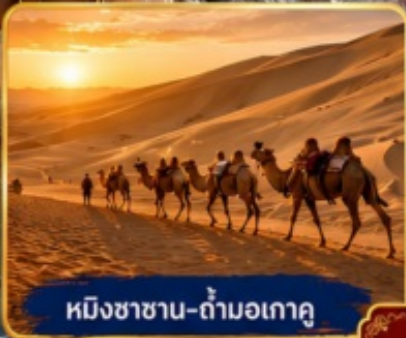
หมิงซาซาน-กำมอเกา