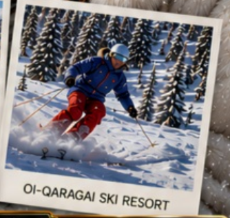
OI-QARAGAI SKI RESORT