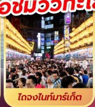
ไถจงไนท์มาร์เก็ต