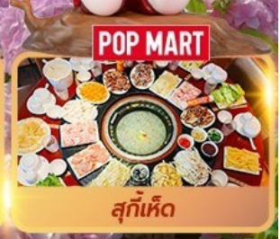
POP MART สุกี้เห็ด