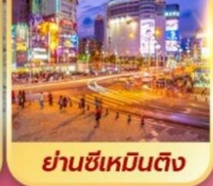
ย่านซีเหมินต้ง