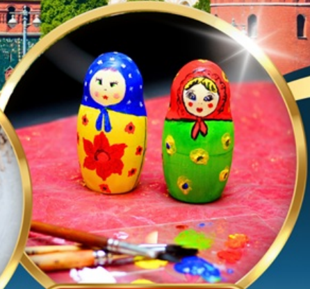
• MATRYOSHKA PAINTING •

น้ำหนักกระเป๋า 30 กิโล รวมประกันการเดินทาง พักโรงแรม 4 ดาว อาหาร 15 มื้อ