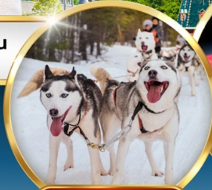
• SAAMI VILLAGE •