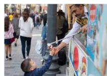
ไอศกรีม Maraş ชมพระอาทิตย์ตกดิน ณ ภูเขาเนมรุต