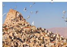
หมู่บ้านของนกพิราบ