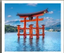
ศาลเจ้าอิตสึคุชิมะ