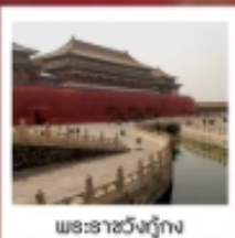
พระราชวังปักกิ่ง