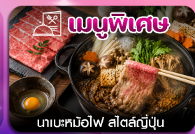
เมนูพิเศษ นาเบะคินอิโง สัตสด์ญี่ปุ่น

SCAN ME ซึบโปโร-ฮาชิว่า-ลานสกีซึกิไซ-คลองโอตารุ-โรงงานช็อกโกแลต-หมู่บ้านเทพนิยาย-ช้อปปิ้งทากุจิโคจิ-อีสะะเต็มวัน