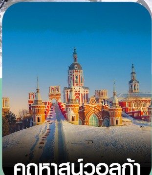
คฤหาสน์วอลก้า