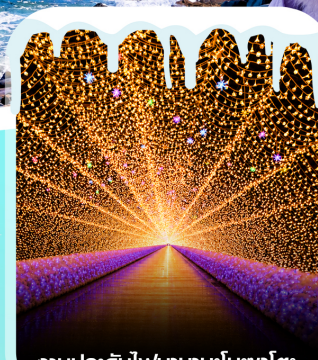
งานประดับไฟนานะโนะซาโตะ