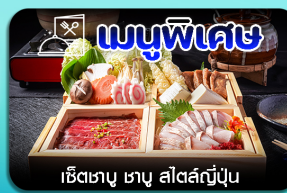
เชิซซาบู ซาบู สีสต์ญี่ปุ่น