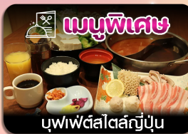
บุฟเฟ่ต์สไตล์ญี่ปุ่น

ซึบโปโร-ชมทุ่งดอกลาเวนเดอร์-โทมิตะฟาร์ม-ชิชิโนะโอะกะ-น้ำตกชิราอิเกะ-บ่อน้ำสีฟ้า-อีสระะซ็อบบิงเต็มวัน-พิกออนเซน