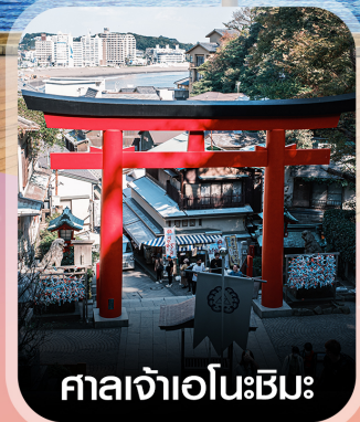
ศาลเจ้าเอโนะชิมะ