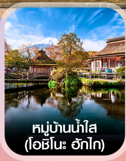
หมู่บ้านน้ำใส (โอชิโนะ ะทาค)