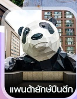
แพนด้ายักษ์ป็นตัก

คอนเฟิร์มออกเดินทาง ทุกพีเรียด 2ก่านขึ้นไป