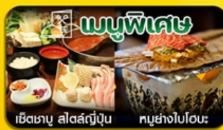
เมนูพิเศษ เช็ดเตาบุ สลัดสตูญี่ปุ่น พูย่างไปโอะ

SCAN ME ฮาคุบะ-นั่งกระเช้าชมวิว-กาแฟ City Breakery-ชิราคาวะโกะ-ทาคายาม่า-วัดน้ำใส- ช้อปปิ้งชินโซบาชิ-อีสะ ช้อปปิ้งเต็มวัน