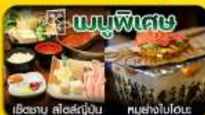
เช็ต ซาซึ ซาซึ สไตล์ญี่ปุ่น , เซ็ตหมูย่างใบโหระพา