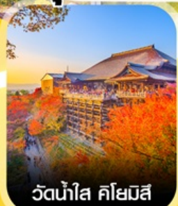
วัดน้ำใส คิโยมิจิ

คอนเฟิร์ม ออกเดินทาง ทุกพีเรียด 2 ท่านขึ้นไป