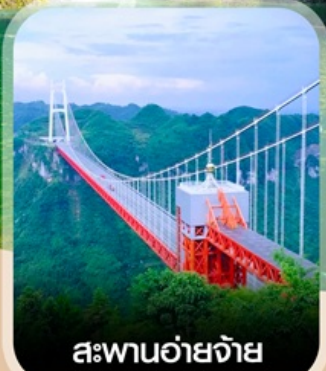
สะพานอ้ายจ้าย