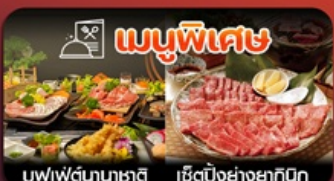
เมนูพิเศษ นูฟฟัดนาชาติ เซ็ตบั้งย่างยากิบิ

ฟุกุโอกะ-วัดนินโซอิน-หมู่บ้านยูฟูอิน-แบบบุ-บ่อนรกจิกุ-แซ่ออนเซ็น-ช็อบปีงเทนจิน-พักใกล้แหล่งช็อบปีง2คืน