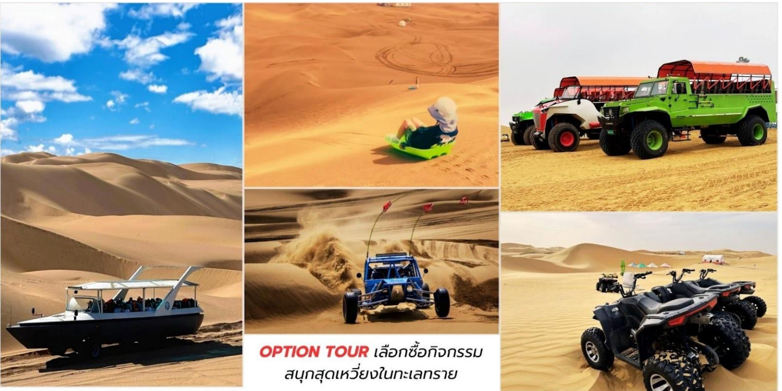
OPTION TOUR เลือกซื้อกิจกรรม สนุกสุดเหวี่ยงในทะเลทราย

*หมายเหตุ อัตราค่าบริการอาจมีการเปลี่ยนแปลง โปรดตรวจสอบ ณ จุดจำหน่ายบัตรอีกครั้ง