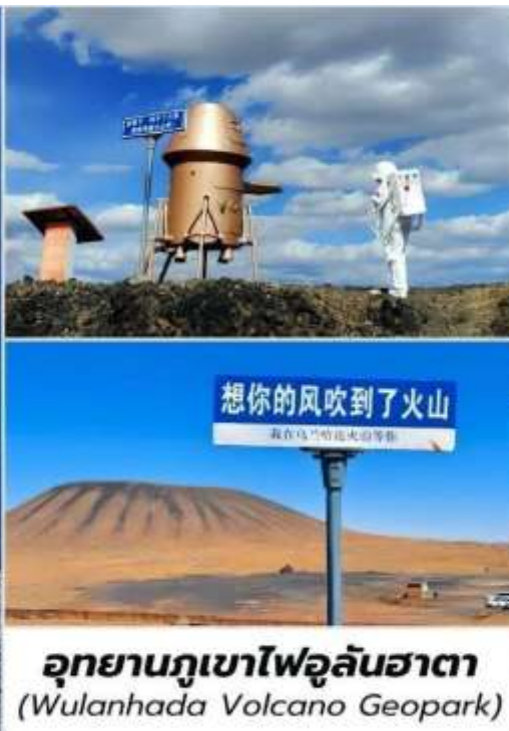
อุทยานภูเขาไฟอูลันฮาตา (Wulanhada Volcano Geopark)