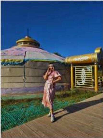
ทุ่งหญ้าออร์ดอส (Ordos Prairie)

OPTION TOUR ท่านสามารถเลือกซื้อบริการเพิ่ม ราคา 380 หยวน ต่อท่าน สามารถเลือกกิจกรรมอื่นๆที่น่าสนใจ ได้ 12 รายการดังนี้