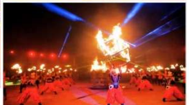
งานราตรีรอบกองไฟมองโก