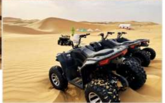
OPTION TOUR เลือกซื้อกิจกรรม สนุกสุดเหวี่ยงในทะเลทราย