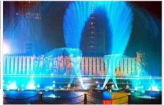
น้ำพุคังปาซือ Kangbashi Fountain

แต่ยังได้รับการกล่าวขานว่าเป็นหนึ่งในน้ำพุที่สูงและยิ่งใหญ่ที่สุดในเอเชีย สามารถพ่นน้ำได้สูงถึง 230 เมตร ระบายน้ำพุคังปาซือไม่ใช่แค่ น้ำพุธรรมดา แต่เป็นการแสดงที่ผสมผสานระหว่างการเคลื่อนไหวของสายน้ำ