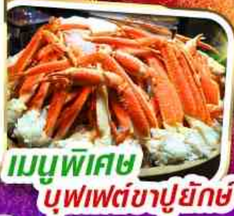
เมนูพิเศษ บุฟเฟ่ต์ขาปูยักษ์

ราคาเพียง 35,999 *รวมภาษีมูลค่าเพิ่มแล้ว*