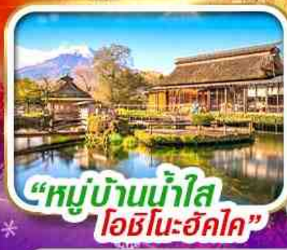
“หมู่บ้านน้ำใส โอชิโนะฮัทสึคิ”