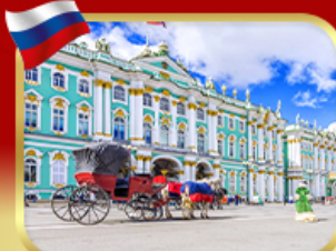
เช่าชมพิพิธภัณฑ์ออร์มิทา