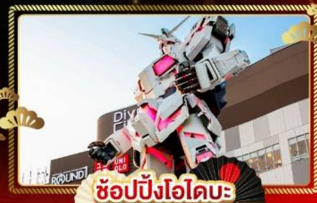
ช้อปปิงโอไดบะ