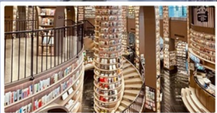
ร้านหนังสือจุงชูก่อ