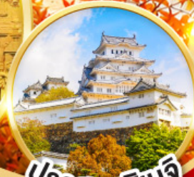
ปราสาทโอเมจิ