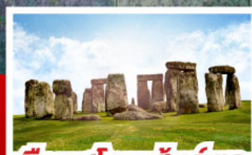
เยือนสโตนเฮ็นจ์ และ พิพีรภัณฑโรมันบาร