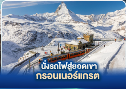
นั่งรถไฟสู่ยอดเขา กรอนเนอร์เกรต