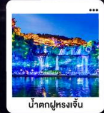
น้ำตกฝูหลงจิ้น

"มหัศจรรย์...จางเจียเจีย" | ดินแดนแห่งขุนเขาและสายน้ำ "เขาเกียนเหมินซาน" | ประตูดวง...ทำกายสิทธิ์รา 999 ชั้น | นั่งรถไฟความเร็วสูง สัมผัสความสวยงามระเบียงแก้ว "อุทยานอวตาร" | ส่องล่องกลางขุนเขา...ดั่งภาพฝันในห้วงนเจียเจีย | ซุปปิ้ง POPMART "เมืองโบราณ" ฝูหลง" หยุตเวลา ณ เมืองบนม่านน้ำตก... | "เฟิ่งหวง" ล่องเรือชมชีวิตริมแม่น้ำทิวเจียง "นครฉางซา" ปิดท้ายความทันสมัย