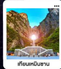
เกียนเหมินซาน