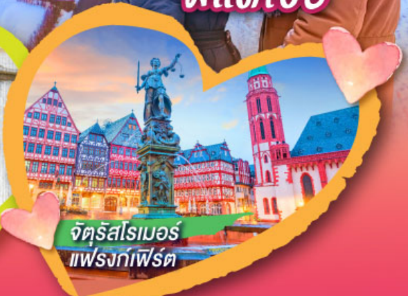
จัตุรัสโรเมอร์ แพรงก์เฟิร์ต