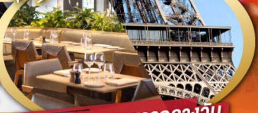
รับประทานอาหารกลางวัน บนหอคอยไอเฟล

ไฮไลท์ในโปรแกรม • ถ่ายรูปคู่มือไอเฟลและพิพิธภัณฑ์ลูฟว์ • สะพานไม้ชาเปล ลูเซิร์น • ขึ้นกระเช้าสู่ยอดเขาจุงเฟรา • เมืองมรดกโลก กรุงเบิร์น • ถ่ายรูปปราสาทซิลยงที่มองเทรอซ • ศาลาไทย เมืองโลซานน์ • เดินเพลินๆ ณ เมืองเวเวย์